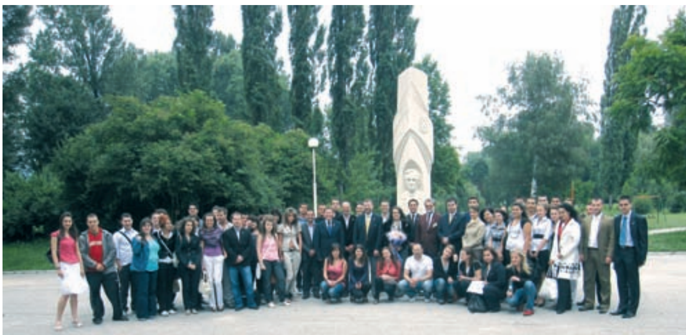
Участниците в конференцията поднесоха цветя пред паметника на първия български ротарианец Събо Николов