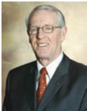
Карл-Вилхелм Стенхамар, председател на Съвета на попечителите на Фондация Ротари

П илотният проект “План с визия за бъдещето” стартира от първи юли. Фондация Ротари вложи много усилия в този план. Въз основа на проучване сред 10 000 ротарианци, извършено от две консултантски фирми, Комисията “Визия за бъдещето” и попечителите на Фондация Ротари работиха упорито за реализацията на проекта.