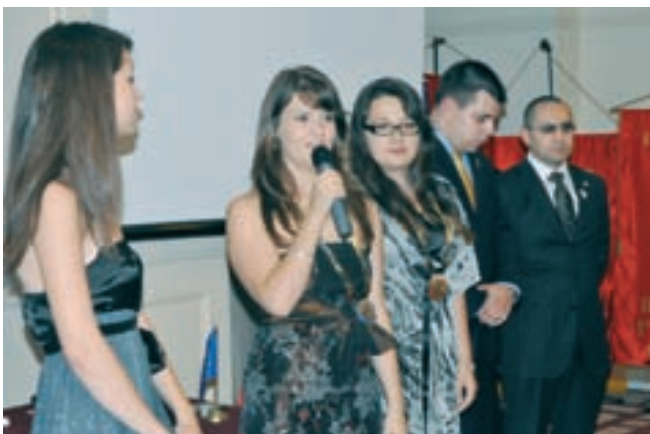
Лидерите на Ротаракт и Интеракт също размениха огърлиците си