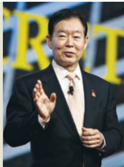
Генералният секретар на РИ Ег Фута се оттегля

Кандидатите трябва да имат висше образование, силен интерес и отлично да познават програмите и мисията на Ротари Интернешънъл, но не е задължително да са ротарианци.