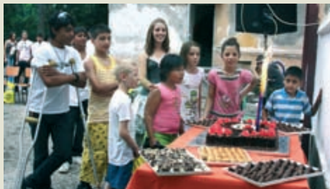
Лакомства за децата от Дом "Проф. д-р А. Златаров"

Друг голям проект на клуба е този, съвместно с представители на Ротаракт клубове от Турския Дистрикт, когато 8 български Ротаракт клуба се побратимиха с приятели от 8 турски Ротаракт клуба. Съвместната дейност се изяви в засаждане на дръвчета на Ротарианската алея в парк "Кенана" в гр. Хасково, тържество и дарения за децата от дом за деца, лишени от родителска грижа "Проф. д-р А.Златаров". За тях още за Коледните празници местният Ротаракт клуб организира